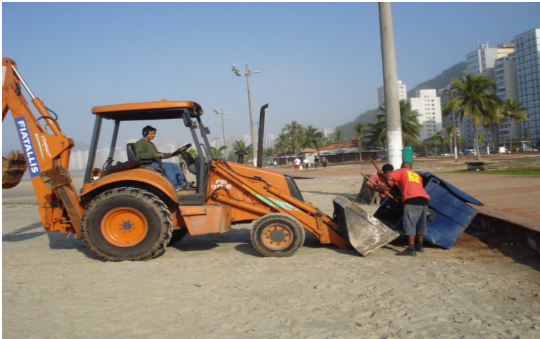
Figura 02: Execução de limpeza de praia. Fonte: Companhia de Desenvolvimento de São Vicente (2009)