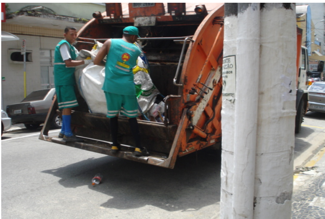
Figura 03: Coleta seletiva.