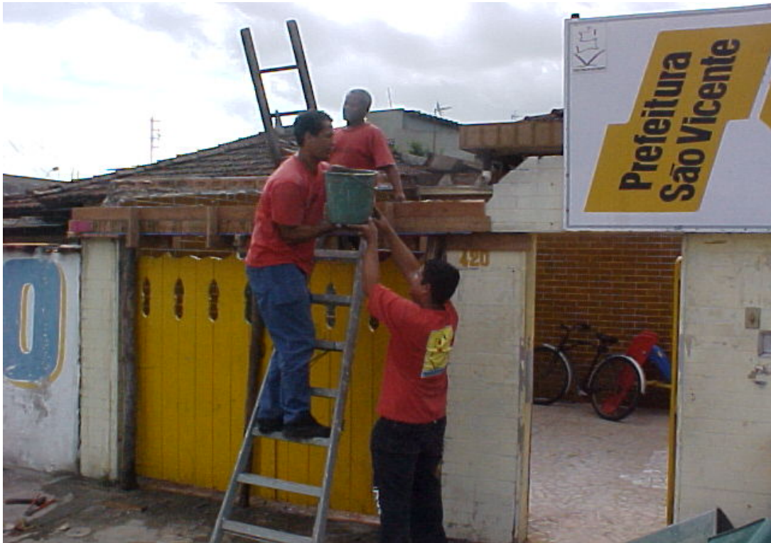
Figura 01: Atendimento de solicitações de manutenção em creche municipal.